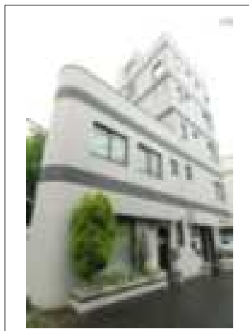
環境試験センター