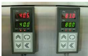
温湿度制御範囲図