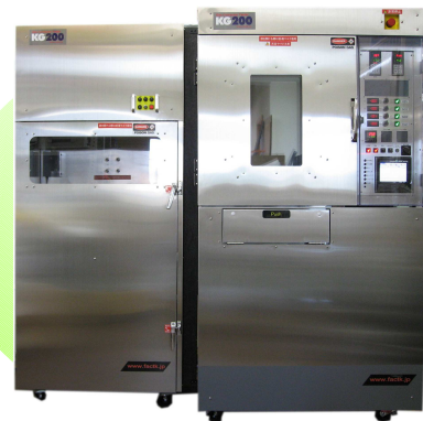
シリンダーキャビネット SK200