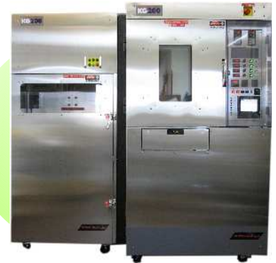
シリンダーキャビネット SK200

オプション 更なる安全を確保すべく元栓遮断装置等オプションにて取り揃えております。