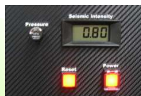
震度センサー拡大