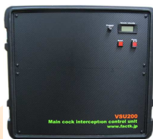
緊急元栓遮断装置 VSU200

オプション 既にお持ちの外部ガス警報装置への接続 Wi-Fi、イーサネットでの通信接続も可能です。