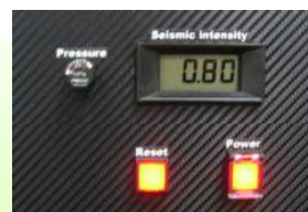
震度センサー拡大