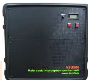
緊急元栓遮断装置 VSU200

オプション 既にお持ちの外部ガス警報装置への接続 Wi-Fi、イーサネットでの通信接続も可能です。