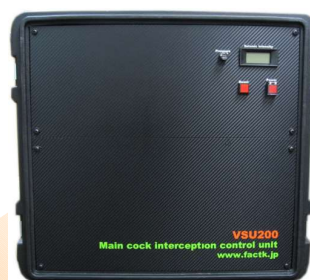
緊急元栓遮断装置 VSU200

オプション 既にお持ちの外部ガス警報装置への接続 Wi-Fi、イーサネットでの通信接続も可能です。